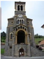
St Clément sous Valsonne