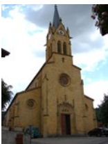
St Romain de Popey